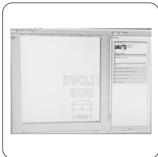
Étape 1 Conception du marquage