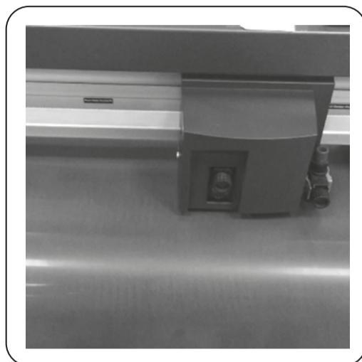
Étape 2 Découpe