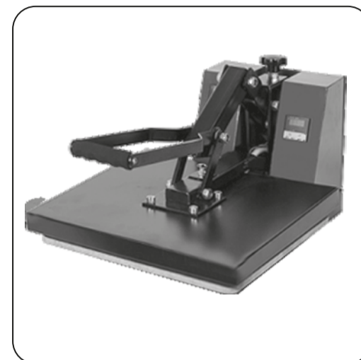
Étape 4 Pressage