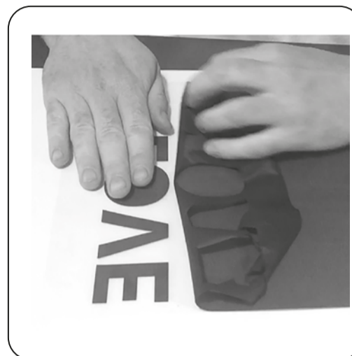
Étape 3 Échenillage