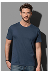
ST2100 Comfort-T 185