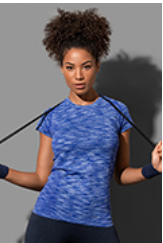
ST8900 Seamless Raglan