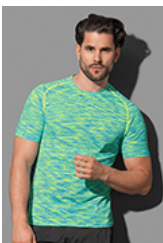
ST8800 Seamless Raglan