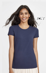
MILLENIUM WOMEN 02946