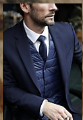
NEOBLU MARIUS MEN 03164