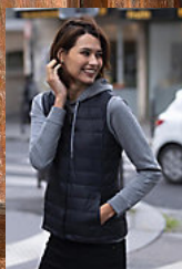
NEOBLU ARTHUR WOMEN 03173