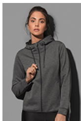
ST5940 Recycled Scuba Jacket