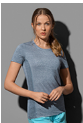
ST8950 Recycled Sports-T Race