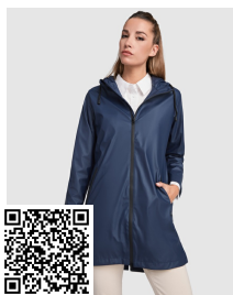
SITKA WOMAN CB5202