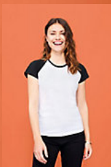
SOL'S MILKY 11195