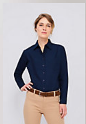
SOL'S EXECUTIVE 16060