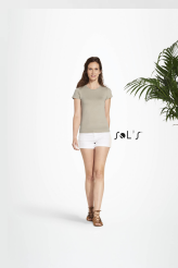
ORGANIC WOMEN 11990