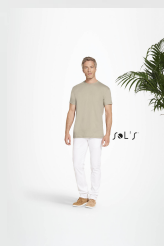
ORGANIC MEN 11980