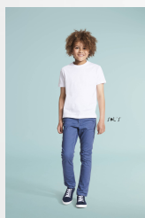
ORGANIC KIDS 11978