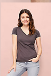
SOL'S MOON 11388