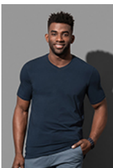
ST9610 Clive V-neck