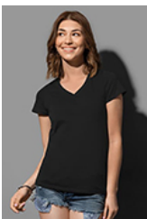
ST9310 Janet Organic V-neck