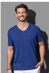
ST9410 Shawn Slub V-neck