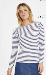
MARINE WOMEN 01403