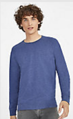
SOL'S STUDIO MEN 01408