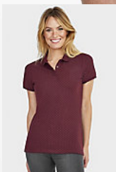
SOL'S BRANDY WOMEN 01707