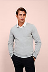
SOL'S GLORY MEN 01710